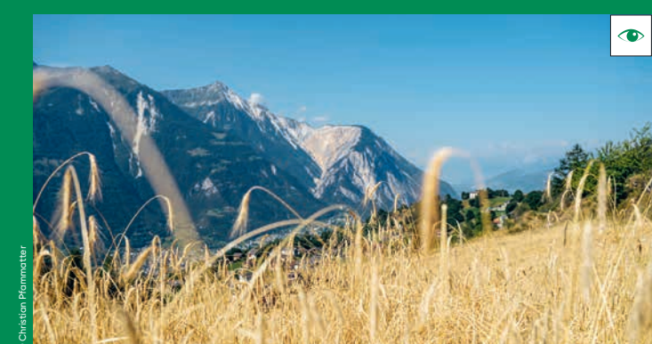
Sonne tanken im Regionalen Naturpark Pfyn-Finges Faites le plein de soleil dans le Parc naturel régional Pfyn-Finges