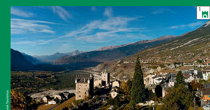
Leuk-Stadt, wo das Mittelalter noch Zukunft hat Loèche-Ville où le Moyen-Âge se tourne vers l'avenir