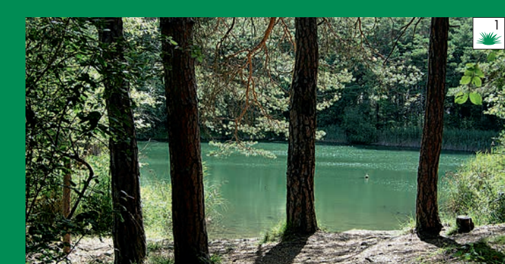
Naturschutzgebiet Pfynwald: Stauen Sie selbst! Site protégé du Bois de Finges: Emerveilleez-vous