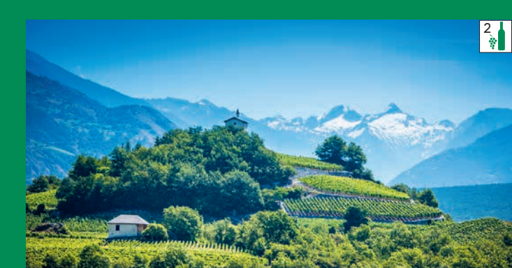
Naturpark Pfyn-Finges, der Weinpark der Schweiz Parc naturel Pfyn-Finges, le parc viticole de la Suisse