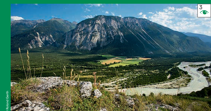
Die wilde Rhone in ihrer Urgewalt inmitten mediterraner Ambiente Le Rhône sauvage dans toute sa force et son ambiance méditerranéenne