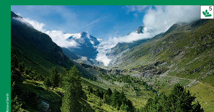
Turtmannal – das Bergerlebnis La vallée alpine par excellence