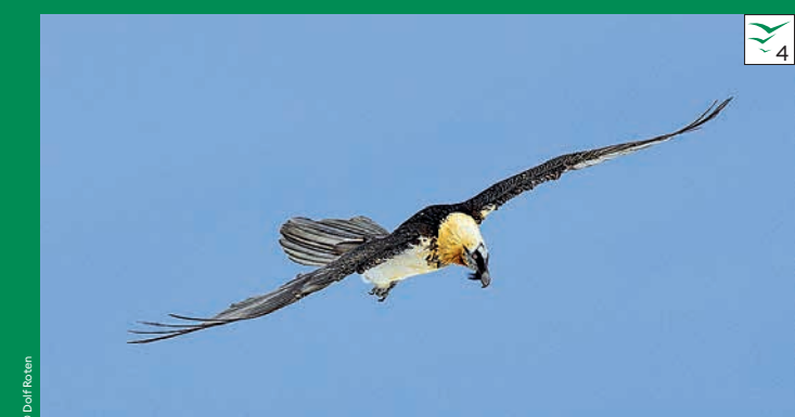
Mit einer Spannweite bis zu 2,90 m ist der Bartgeier der grösste Einwohner des Naturparks Avec une envergure pouvant atteindre 2,90 m, le gypaète barbu est le plus grand habitant du Parc naturel